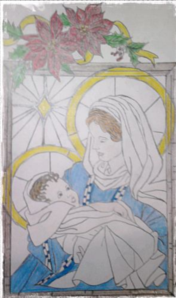
Rajz: Földi Petra

10. A legnagyobb karácsonyfát Seattle-ben állították fel 1950-ben, amely egy 67,4 méteres Douglas-fenyő volt.